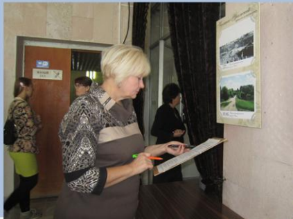
Викторина по выставке фотографий