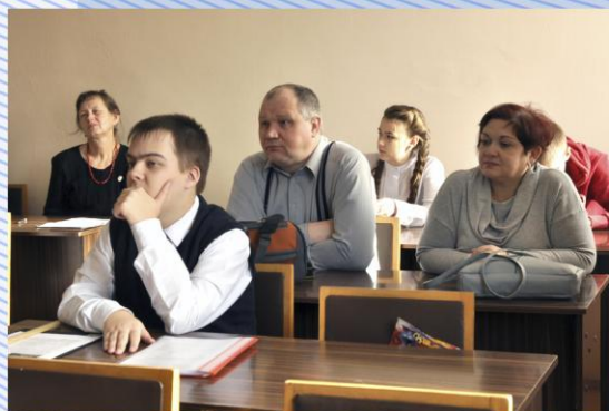
Секция "Летопись родного края"