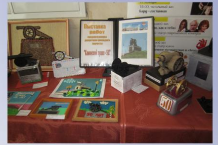
Выставка работ учащихся