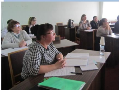
Секция "Город и люди"