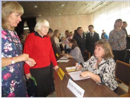
Регистрация участников конференции