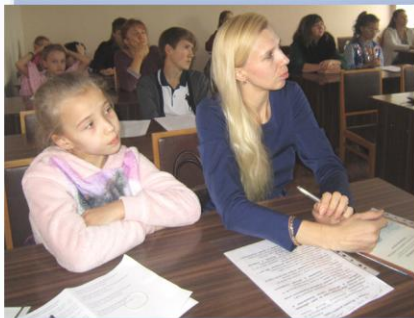
Работа секции "Летопись родного края"