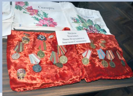
Из семейного архива Птицина Степана