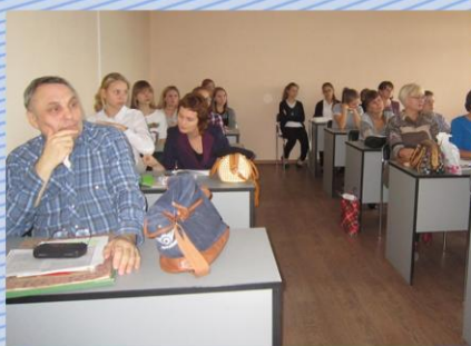
Секция "Образование, история и современность"