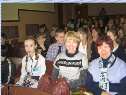
Постоянные участники конференции