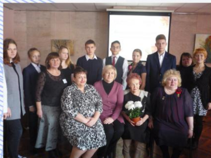
Участники секции "Родоведение"