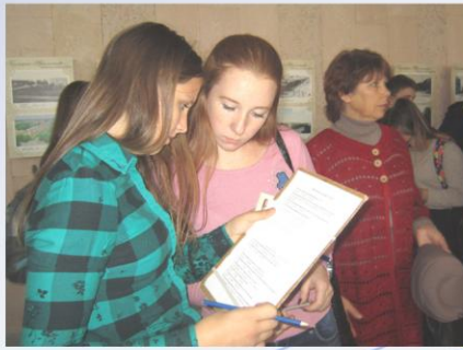
Викторина "Город старый и новый"