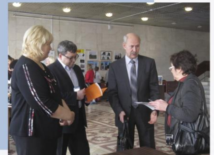
Почетные гости конференции